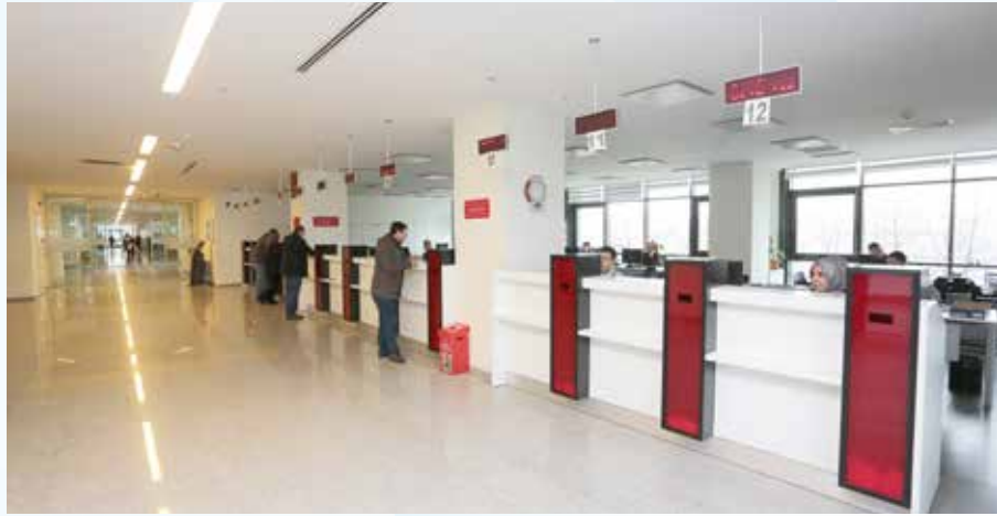
» Emlak Servisi