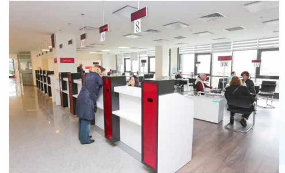
» Kentli Servis

Gelir bütçesi incelendiğinde Vergi Gelirleri % 32,15 gerçekleştirme oranı ile 114.135.128,51 TL olarak gerçekleşmiştir. Teşebbüs ve Mülkiyet Gelirleri % 5,74 gerçekleştirme oranı ile 20.388.932,32 TL olarak, Alınan Bağış ve Yardımlar % 0,03 gerçekleştirme ile 86.661,94 TL olarak, Diğer Gelirler % 40,01 gerçekleştirme ile 142.064.311,65 TL olarak gerçekleştirilmiştir.