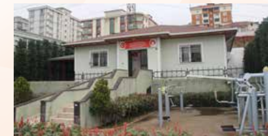
» Tatlısu Muhtarlığı

2015 yılı içerisinde Huzur ve Şerifali mahalleleri muhtarlık binalarımız tamamlanarak hizmete açılmıştır.