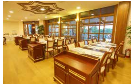
» Restoran Bölümü