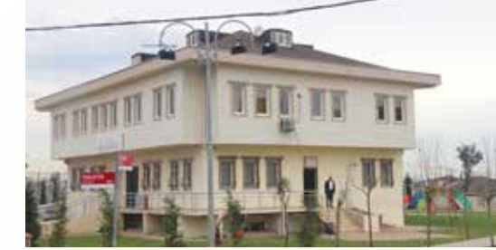
» Dumlupınar Muhtarlığı