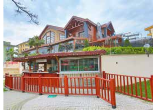
» Tantavi Sosyal Tesisler

Tesisimizde kaliteli hizmet ve uygun fiyat anlayışı ile her Cumartesi - Pazar 10.00 - 13.00 Saatleri arasında, Açık Büfe Kahvaltı hizmeti sunmaktadır. Tesisimiz yoğun talep dolayısıyla hafta sonları rezervasyon sistemi ile hizmet vermektedir.