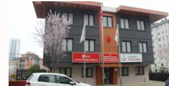
» Şerifali Muhtarlığı