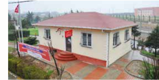
» İnkılap Muhtarlığı