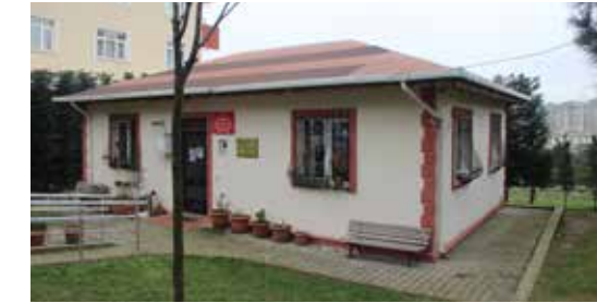
» Çamlık Muhtarlığı

İlçemizin 35 Mahalle Muhtarlığından 24 adet Muhtarlık binası Belediyemiz tarafından yapılmıştır, 5 adet mahallemizin Muhtarlık binası yapımına ilişkin çalışmalarımız devam etmektedir. Belediye Başkanlığımızca sürdürülen mahalle muhtarlık binalarımızın yapımı kapsamında, 2015 yılı içerisinde Huzur ve Şerifali mahalle muhtarlık binalarımız tamamlanarak hizmete alınmıştır.