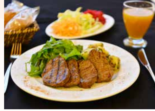
» Restoran Bölümü