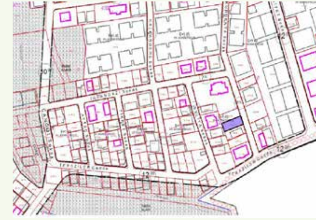
» Arsa Satışı Plan Örneği

2013 yılında mülkiyeti Belediyemize ait olan 5 adet arsanın satışı ve devri ile birlikte 15 adet taşınmazdan Belediye bütçesine toplam 40.947.450,50 TL gelir sağlanmıştır.