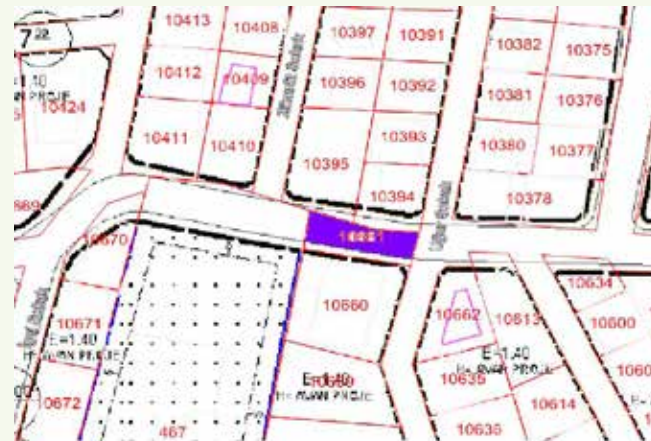
» Kamulaştırma Plan Örneği