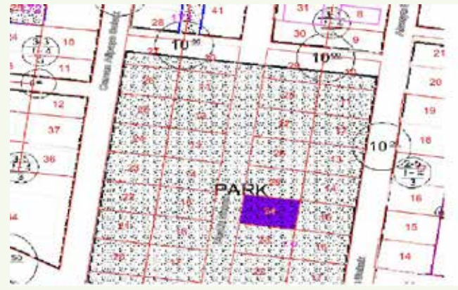
» Kamulaştırma Plan Örneği