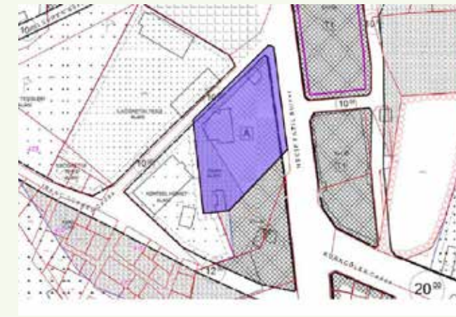
» Arsa Satışı Plan Örneği