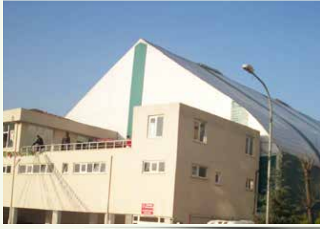
» Atakent - Spor Tesisleri