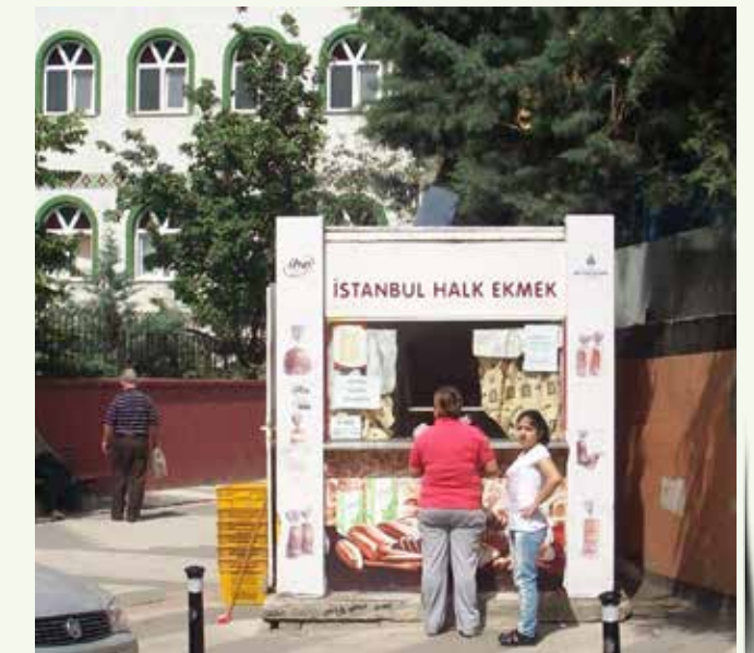
» Halk Ekmek Büfesi

» 2013 yılında belediyemizin kira ve ecr-i misil gelirleri tahsilatı Toplam 6.248.754,72 TL dir.