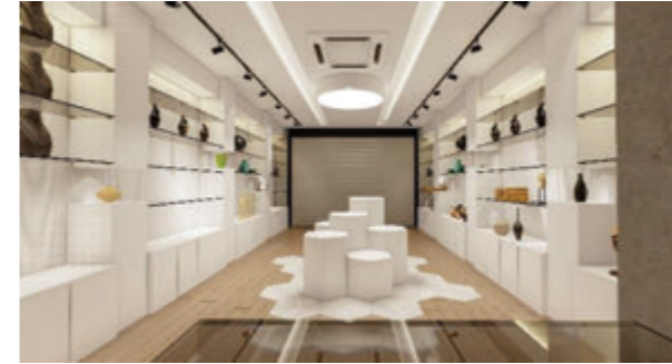
IGA Mağaza Projesi