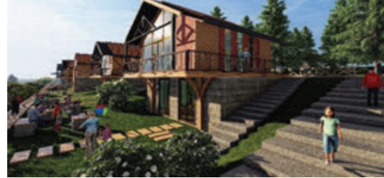
Kamu Hizmet Yapıları