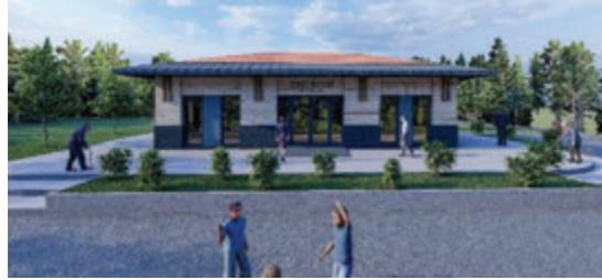
Kamu Hizmet Yapıları