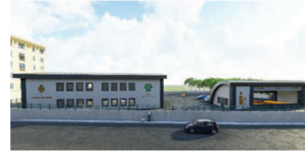
Atık Getirme Projesi