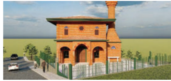
Dini Tesis Alanı Projesi