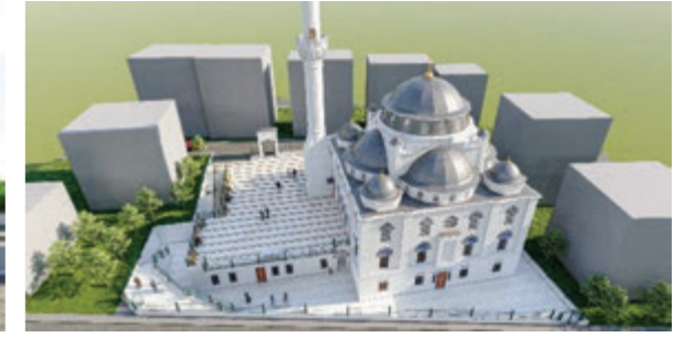
Dini Tesis Projesi